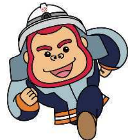
須賀川地方広域消防組合イメージキャラクター 「マモタン」

春の火災予防運動 3月1日～3月7日 秋の火災予防運動 11月9日～11月15日